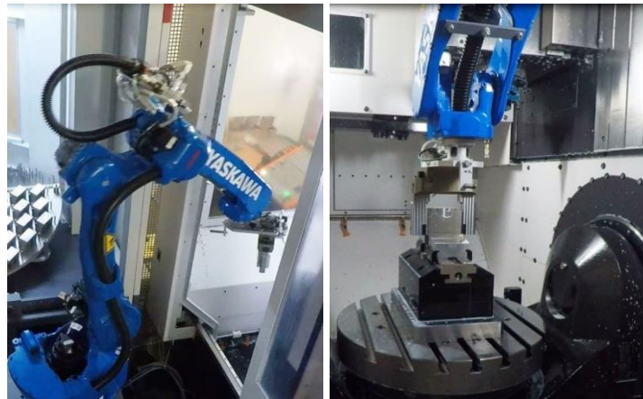
Beispiel: Bestückung einer 5-Achs Fräsmaschine