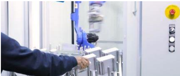
Bediener & Roboter arbeiten hauptzeitparallel an der Zelle

steigert Ihre Flexibilität und Produktivität