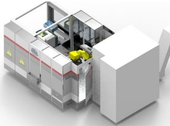
Beladen des BAZ `S

RILE Roboter und Anlagentechnik GmbH Graflinger Strasse 226 D-94469 Deggendorf / Germany Tel. +49 (0) 991-2507-280 Fax: +49 (0) 991-2507-211 eMail: sales@rile-group.com Internet: www.rile-group.com