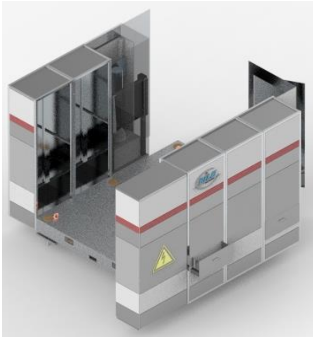
Grundplatte mit seitlichen Funktionsschränken